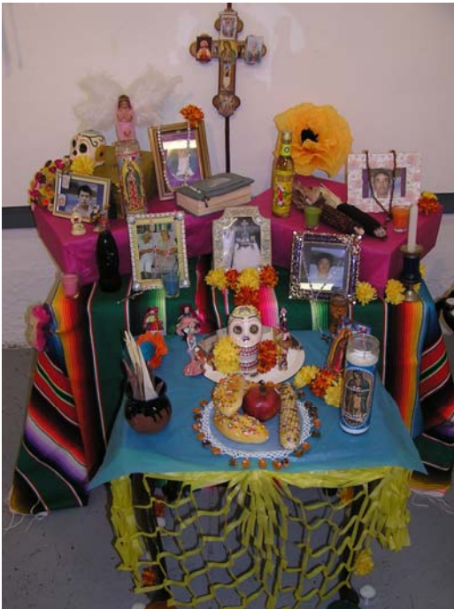
Altar hecho por Guirsel Franco